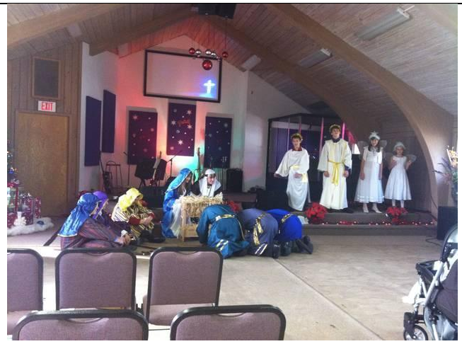
"Путь Господень", г. Сакраменто, США.