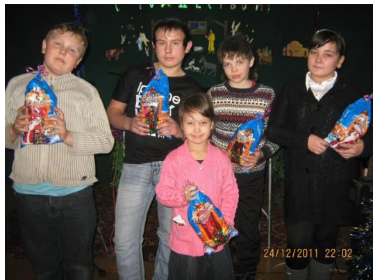
"Благая Весть", п. Шахан, Казахстан.

Церковь Благая Весть п. Шахан хотела бы сказать слова благодарности нашим Друзьям из общины Краеугольный Камень, за их финансовый вклад в приготовлении Рождественских подарков для наших детей. Пусть Господь обильно воздаст Вам по богатству и милости своей к Вам!